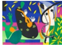
La Tristesse du roi